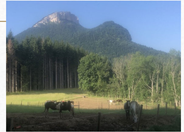
La vie quotidienne