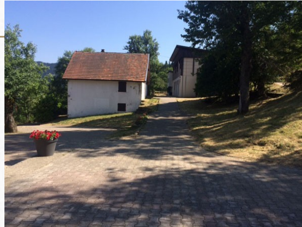
Lieu de vie