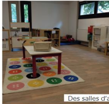
Des salles d'activités rénovées