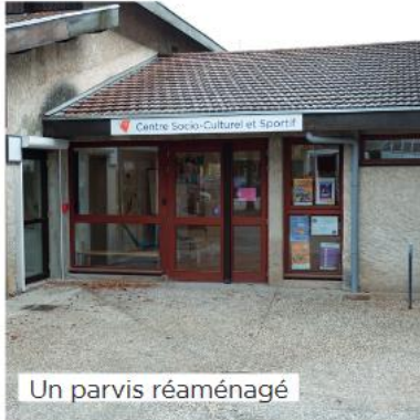
Un parvis réaménagé

Le responsable du centre aménagera les locaux pour la période afin de créer une ambiance vacances et ludique adaptée aux différentes tranches d'âge.