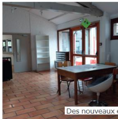
Des nouveaux espaces d'activités