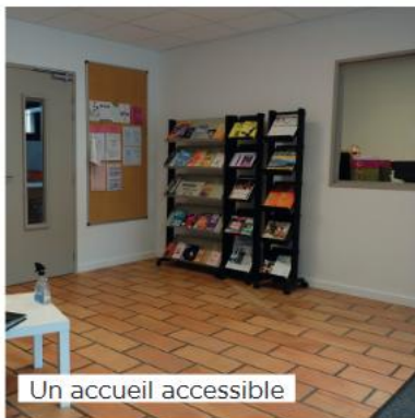
Un accueil accessible